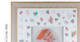
Nispetiye Yürüyüşü / 1998 Türkiye Kültür Bakanlığı