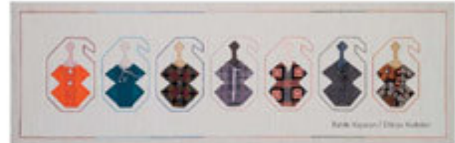
Bahar Kaya / Nispetiye Yürüyüşü