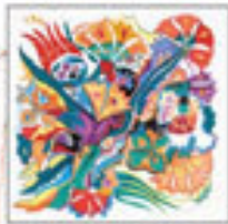
Nispetiye Yürüyüşü / 1998 Türkiye Kültür Bakanlığı