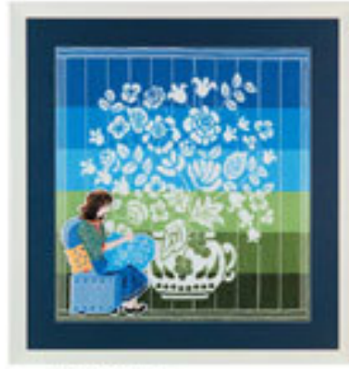
Elvira İsmailik / Nispetiye Yürüyüşü