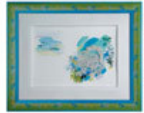
Nispetiye Yürüyüşü / 1998 Türkiye Kültür Bakanlığı