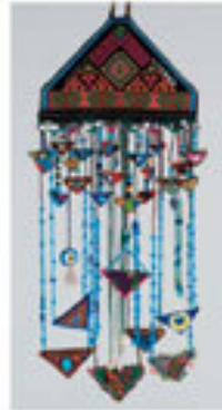
Nispetiye Yürüyüşü / 1998 Türkiye Kültür Bakanlığı