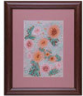
Nispetiye Yürüyüşü / 1998 Türkiye Kültür Bakanlığı