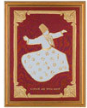
Özlem Akın / Türkiye