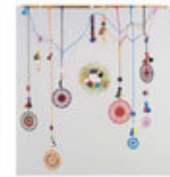
Nispetiye Yürüyüşü / 1998 Türkiye Kültür Bakanlığı