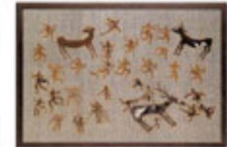
Nispetiye Yürüyüşü / 1998 Türkiye Kültür Bakanlığı