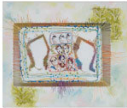
Bahar Kaya / Nispetiye Yürüyüşü